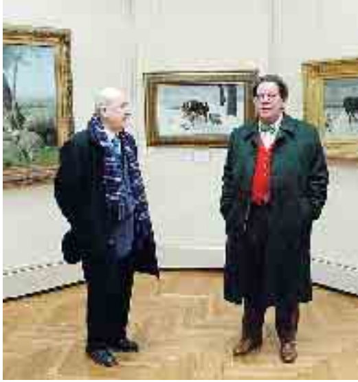
Folto pubblico all'auditorium della Fondazione per Philippe Daverio. Sopra il critico con Vittorio Anelli alla Ricci Oddi

«I mille Garibaldini? Furono praticamente una sorta di movimento studentesco ante litteram»