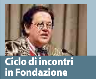
Ciclo di incontri in Fondazione

Pubblico foltissimo per il critico d'arte che ieri ha fatto visita anche alla "Ricci Oddi"